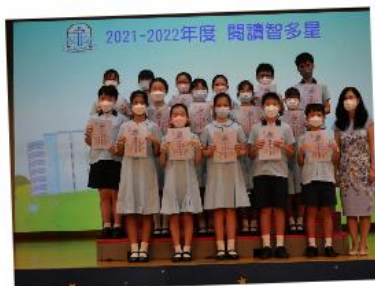
下學期結業禮及頒獎禮